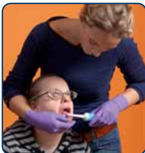
1. Ga achter uw kind of cliënt staan

Een juiste poetshouding is belangrijker dan u wellicht denkt. Te vaak staan ouders of begeleiders voor hun kind of cliënt. Maar dan heeft u weinig zicht in de mond, heeft u geen controle over uw kind of cliënt en staat u zelf in een kwetsbare positie. Laat uw kind of cliënt zitten en ga schuin achter hem staan. Fixeer het hoofd en kijk in de mond wat u doet. Druk de wang met uw vinger in de mond van uw kind of cliënt opzij en duw met uw duim de lip weg.