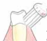
Zet de tandenborstel onder een hoek van 45 graden op het tandvlees