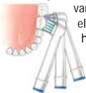
Volg de vorm van de tanden en kiezen

Houd een vaste poetsvolgorde aan. Begin steeds voorzichtig aan de buitenkant in de bovenkaak en poets die helemaal. Schuif de borstel steeds één tand of kies op. Poets dan de hele binnenkant van de bovenkaak. Doe dat ook weer tand voor tand. Let erop dat u de borstelkop diep tussen de kiezen en tong plaatst. Anders raken de borstelharen de kiezen niet goed en wordt het randje van het tandvlees niet schoon. Poets ook de achterkant van de laatste kies zorgvuldig. Poets vervolgens bovenop de kiezen (de kauwvlakken). Poets ook hier weer kies voor kies. Poets daarna op dezelfde manier de buitenkant van de onderkaak, gevolgd door de binnenkant en ten slotte weer bovenop.