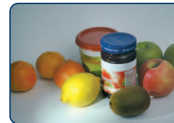
Alle zure voedingsmiddelen kunnen schadelijk zijn

Alle zure voedingsmiddelen, hoe gezond ook, kunnen schadelijk zijn voor uw gebit. Vooral voor zuur fruit moet u oppassen. Denk aan citrusvruchten, bramen en bessen, appels, druiven, kiwi's en mango's, maar ook aan de producten daarvan (appelstroop, jam, vruchtensap). Ook alle levensmiddelen die zijn aanzuurd met bijvoorbeeld azijn- of citroenzuur, veroorzaken bij veelvuldig gebruik tanderosie. Denk aan bijvoorbeeld slasaus of mayonaise. Veel mensen zuigen op vitamine C tabletten in plaats van ze direct door te slikken. Dat kan funest zijn voor de tanden. Vitamine C producten zijn van zichzelf al licht zuur en bovendien zijn ze nog eens op smaak gebracht door toevoegingen van een zoetstof en citroenzuur.