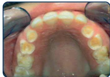
Tanderosie bij een kind van 8 jaar

Meestal merkt u tanderosie pas op in een vergevorderd stadium. Als u klachten krijgt bij het eten of drinken bijvoorbeeld. Vaak is het tandglazuur dan al verdwenen. Tanderosie kunt u pas herkennen als het uiterlijk van de tanden verandert. De voortanden worden korter, dunner en doorschijnender of krijgen rafelige randen. De tanden worden (plaatselijk) steeds geler of de tanden krijgen donkere plekken. Het glazuur wordt namelijk