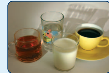
Water, koffie (zonder suiker) en gewone thee (zonder suiker) en melk zijn niet zuur

Beperk het gebruik van zure dranken en zuur voedsel. Neem als alternatief zo mogelijk water, gewone thee (zonder suiker), dus géén vruchten- of kruidenthee, koffie (zonder suiker) of melk. Houd zure producten zo kort mogelijk in uw mond. Spoel de drank dus niet rond in uw mond. Zuig ook niet op zuur snoep of andere zure producten. Beperk het aantal keren dat u eet of drinkt. Gebruik drie maaltijden per dag en daarnaast niet meer dan vier keer iets tussendoor. Eet maximaal een- of tweemaal per dag zuur fruit. Als u bij uw eten drinkt, geldt dat als één moment.