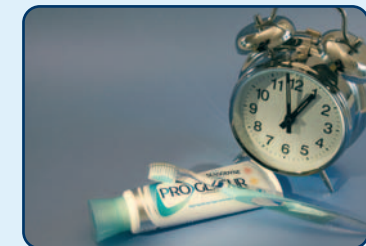
Gebruik geen zure producten één uur voor het tandenpoetsen

Poets tweemaal per dag uw tanden. Gebruik een zachte tandenborstel en een fluoridetandpasta. Reinig de ruimte tussen de tanden en kiezen eenmaal per dag met ragers, flossdraad of tandenstokers. Eet of drink één uur voordat u uw tanden gaat poetsen géén zure producten. Het oppervlak van tanden en kiezen wordt zachter door de inwerking van zuur. Als u direct na het eten of drinken van zuur uw tanden poetst, kunt u de glazuurlaag gemakkelijk wegpoetsen.