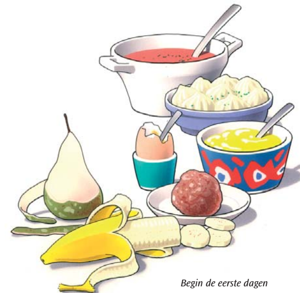
Begin de eerste dagen met zacht voedsel

Eten met uw nieuwe kunstgebit is wat onwennig. Zeker in het begin zult u voorzichtig aan doen. U ervaart zelf het beste wat wel en niet kan. Neem de eerste dagen zacht voedsel, zoals puree, gehakt en zacht fruit. Probeer enkele dagen daarna een stukje vis en een aardappel. Weer later kunt u voedsel eten zoals vlees of een appel. Stukken afbijten kunt u met een kunstgebit beter niet doen. Snijd uw voedsel daarom in stukjes en kauw rustig en gelijkmatig met uw nieuwe kunstkiezen. Neem daarbij aan beide zijden een stukje voedsel in de mond. Neem er iets meer tijd voor dan dat u gewend was.