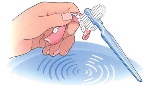
Reinig uw kunstgebit na iedere maaltijd

Uw kunstgebit is nu nog nieuw en mooi. Dat wilt u natuurlijk graag zo houden. Daarom moet u, net als bij eigen tanden en kiezen, uw kunstgebit verzorgen. Als u het niet regelmatig schoonmaakt, blijven er voedselresten achter. Zowel op uw kunstgebit als eronder. Als u die niet verwijdert, kan uw tandvlees op den duur gaan ontsteken. Reinig uw gebit daarom zorgvuldig na iedere maaltijd. Gebruik een speciale protheseborstel, bijvoorbeeld van Lactona of Oral-B, en water om etenresten goed te verwijderen. Gebruik géén tandpasta. Die kan te veel schuren. Een schoon kunstgebit voelt altijd glad aan. Laat uw gladde gebit tijdens het reinigen niet uit uw handen glippen. Het zal kapot gaan. Vul voor de zekerheid eerst de wasbak met water en reinig uw gebit daarboven.