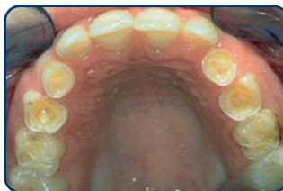
Tanderosie bij een kind van 8 jaar

Tanderosie ziet u pas in een vergevorderd stadium. Als het uiterlijk van de tanden of kiezen verandert. Te laat dus. Gelukkig kan de tandarts of mondhygiënist het eerder ontdekken. Door tanderosie kunnen de voortanden korter en dunner worden (dus kwetsbaarder voor breuk) of ze krijgen doorschijnende en rafelige randen. Verder kunnen de tanden plaatselijk steeds geler worden of donkere plekken krijgen. Het glazuur wordt namelijk dunner en het onderliggende gele tandbeen schijnt er dan doorheen. In de knobbels van de kiezen kunnen putjes ontstaan. In een later stadium kunnen de knobbels van de kiezen zelfs helemaal verdwijnen. Dan kauwt uw kind dus op het tandbeen. Dat geeft pijnklachten en gevoeligheid.