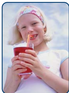
Er worden vaker en meer fris- en sportdranken gedronken

Alle kinderen zijn er gek op: snoep en frisdrank. Alle ouders weten wel dat je van snoepen gaatjes krijgt. Er zit namelijk veel suiker in. Veel minder ouders weten dat in veel zoete producten ook zuren zijn verwerkt. Je proeft ze niet, want de zoete smaak overheerst. Maar die toegevoegde zuren in voeding en dranken veroorzaken wel een ander probleem voor het kindergebit: tanderosie. Het tandglazuur van de nieuwe blijvende tanden van uw kind is nog niet volledig uitgehard. Daarom is het kindergebit extra kwetsbaar voor zuren.