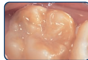
Een kaaskies in een blijvend gebit