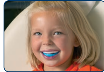
Een fluoridebehandeling bij de tandarts

Als er in korte tijd gaatjes dreigen te ontstaan, kan de tandarts een fluoridebehandeling geven. Hij brengt dan extra fluoride aan met een vloeistof of gel in een lepel. Of de tandarts raadt een extra poetsmoment aan om de kans op gaatjes te verkleinen. Ook adviseert hij wel eens te spoelen met fluoridevloeistof. Vaak adviseert hij om na het poetsen de tandpasta uit