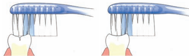
Tandenborstel komt niet in de groef

Bij zowel melkkiezen als blijvende kiezen zitten veel groefjes op het kauwvlak. Daarin ontstaat gemakkelijk tandplak. Niet regelmatig verwijderde plak kan gaatjes veroorzaken. Goed poetsen dus. Om het kauwvlak goed te beschermen, kan de tandarts een laagje 'kunsthars' (sealant) aanbrengen. Dit heet 'sealen'. Diepe groeven kan uw tandarts door het sealen afdichten. Alleen de blijvende kiezen komen normaal gesproken in aanmerking om te sealen. Dit gebeurt meestal kort nadat de blijvende kiezen helemaal zijn doorgebroken. De tandarts zal alleen sealen als hij verwacht dat er gaatjes in de groefjes ontstaan. Ook gesealde kiezen moeten goed worden gepoetst.