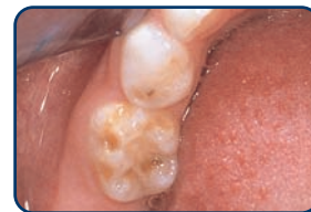
Een kaaskies in een melkgebit

Kaaskiezen zijn kiezen met plekken waarvan het glazuur minder hard is. Deze plekken zijn herkenbaar aan de geelbruine verkleuringen. Meestal treden ze op bij de eerste grote kiezen (zie foto's). De afwijking kan zich beperken tot enkele plekkjes, maar ook kan een heel vlak worden aangetast. In kaaskiezen ontstaan vaak gaatjes. Ook kunnen ze snel afbrokkelen door slijtage. Ze zijn vaak gevoelig voor koud en warm en ook zoetigheid doet vaak zeer. Kinderen met kaaskiezen vermijden daarom wel vaker zoetigheden. Denkt u dat uw kind last heeft van kaaskiezen? Neem dan contact op met uw tandarts.