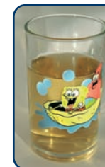
Ook appelsap is een zuur tussendoortje

Behalve goed poetsen, napoetsen en controle, is het belangrijk dat u goed op de voeding van uw kind let. Zowel suiker (gaatjes) als zuur (erosie) kunnen het gebit beschadigen. Beperk daarom het aantal eet- en drinkmomenten tot maximaal zeven per dag. Drie keer een maaltijd en maximaal vier keer per dag een tussendoortje. Het gaat niet alleen om hoe véél zure producten uw kind eet en drinkt. Het gaat vooral om hoe vaak, hoe lang, de tijdstippen en de manier waarop dat gebeurt. Tanderosie is slijtage van het tandglazuur door zuurinwerking. Het is een sluipend proces dat niet gemakkelijk te herstellen is.